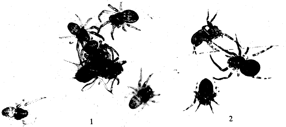
Figure 1. — Nymphes consommant la même proie (le cannibalisme n'est pas encore présent).

Un animal placé à l'extrémité d'un pinceau peut se laisser tomber au bout d'un fil. Cette descente est contrôlée, l'animal peut la ralentir ou l'accélérer sans ou avec l'aide d'une des P4. Au cours de la chute, soit tous les appendices sont écartés, soit une des P4 tient le fil de chute et les P1 et P2 balayent l'espace. L'animal peut remonter le long du fil. L'approche, par un animal, d'un congénère immobile ne déclenche