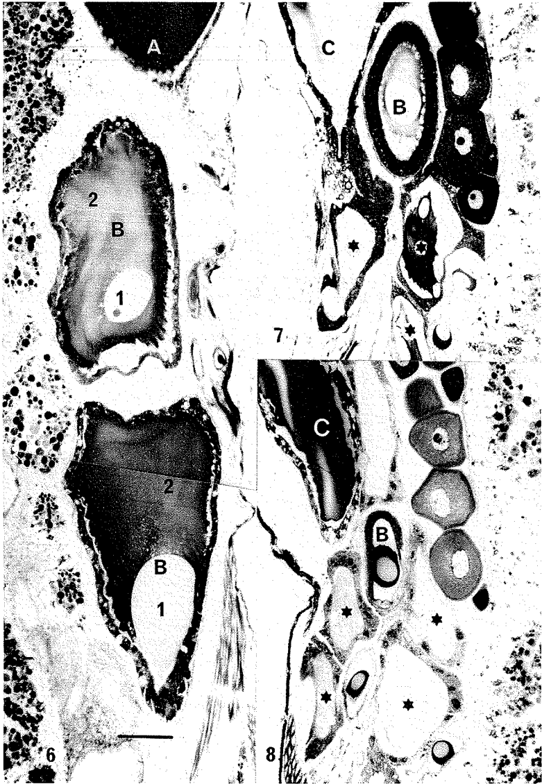
Fig.6 : Coupes histologiques para-sagittale de l'abdomen d'un Pholcus montrant les 2 glandes B emplies de produits de sécrétion (1 et 2), l'une derrière l'autre, contre la paroi abdominale, coupes du canal excréteur d'une glande A.